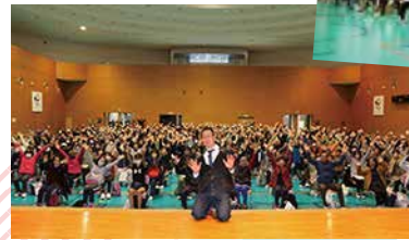
◀最後は全員で記念撮影をしました！