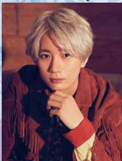
江口拓也 TAKUYA EGUCHI

「機動戦士ガンダムUC」リディ・マーセナス 役、「LUPIN the Third シリーズ」石川五門 役、「ハイキュー!!」及川徹 役、「パンパンパンパンパイア」森蘭丸 役、「SAKAMOTO DAYS」X(スラー) 役、ナレーション「A+Studio+」(TBS) ほか