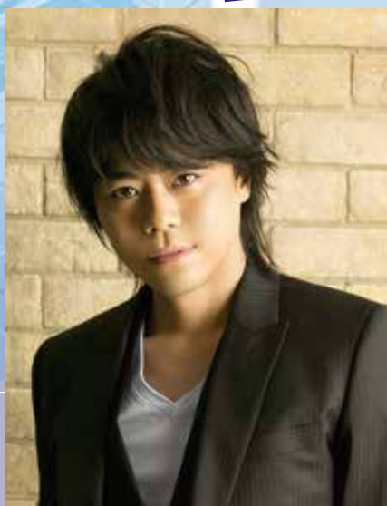
浪川大輔 DAISUKE NAMIKAWA

子供時代から声優として活躍し、アニメから洋画の吹き替えまで様々な役を演じる実力派声優。代表作は「スター・ウォーズ」シリーズのアナキン・スカイウォーカー役等、多数。俳優としても活動し、映画監督に挑戦する等幅広く活動中。