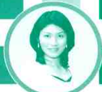
岡本安代氏 (フリーアナウンサー・朗読家)